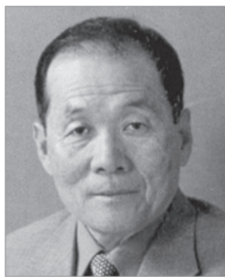
具峻會 이사 120만원