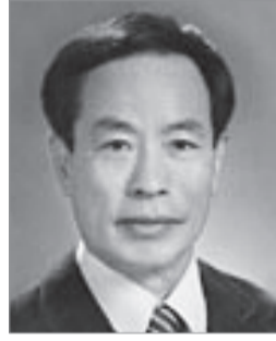
具永會 이사 120만원