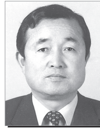
구달회 이사 100만원