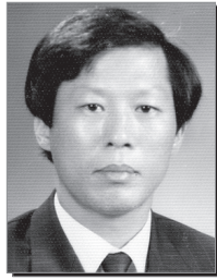
구연도 이사 200만원